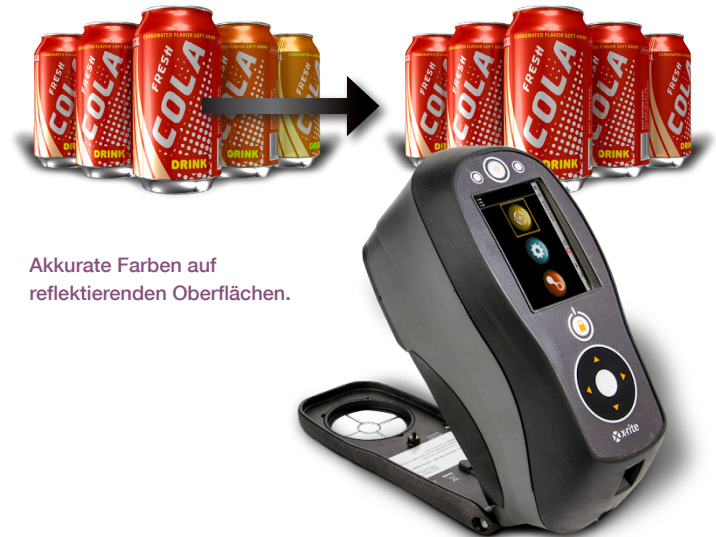
Akkurate Farben auf reflektierenden Oberflächen.