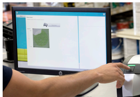
Capture d'un point précis avec le ciblage numérique à l'écran