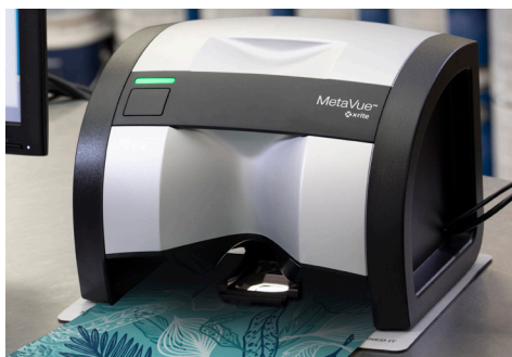
Identification de plusieurs couleurs dans un échantillon