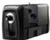
Spettrofotometri da banco a sfera serie Ci7000