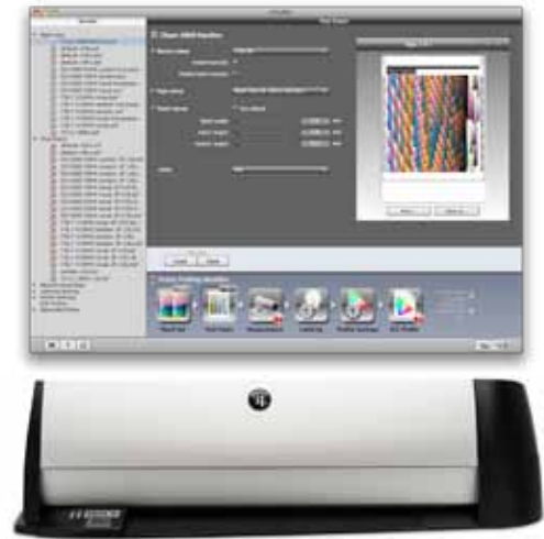
i1iSis 2 und i1 Profiler: Schnell und benutzerfreundlich