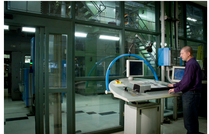
IntelliTrax News ist dank der kleinen Stellfläche und einfachen Benutzung für alle Druckunternehmen geeignet, egal wie groß.