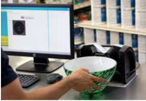
Präzise Messung des gewünschten Probesteils