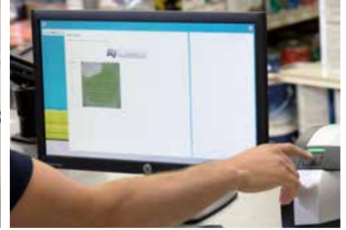
Digital gesteuertes Anvisieren des gewünschten Punkts auf dem Bildschirm