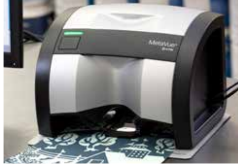
Erkennung mehrerer Farben in einer Probe