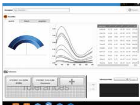
Analisi di misurazioni spettrali