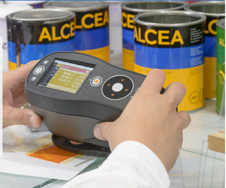
▲ IMAGEN: Ci60 tomando mediciones de muestras en el laboratorio