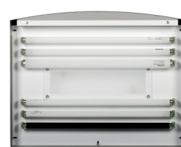
LAMP VIEW (外観)