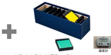
リファレンスタイル測定ベース*