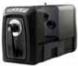
Espectrofotômetros de bancada de esfera Série Ci7000