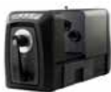
Gamme Ci7000 de spectrophotomètres à sphère de paillasse